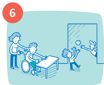
Mijn partner en gezin