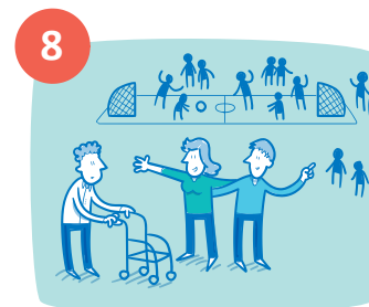
Mijn sociale omgeving