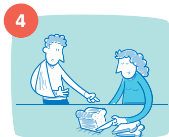
Omgaan met mijn ziekte en de gevolgen daarvan