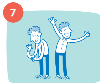
Mijn gevoelens en gedachten