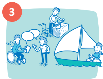
Mijn dagelijks leven en activiteiten